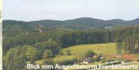
Blick vom Aussichtsturm Frankenwarte

Gesamtlänge: 10,2 km Tiefster Punkt: 567 m Höchster Punkt: 692 m Tourendauer: 2h 45min [bei einer Durchschnittsgeschwindigkeit von 3,8 km/h]