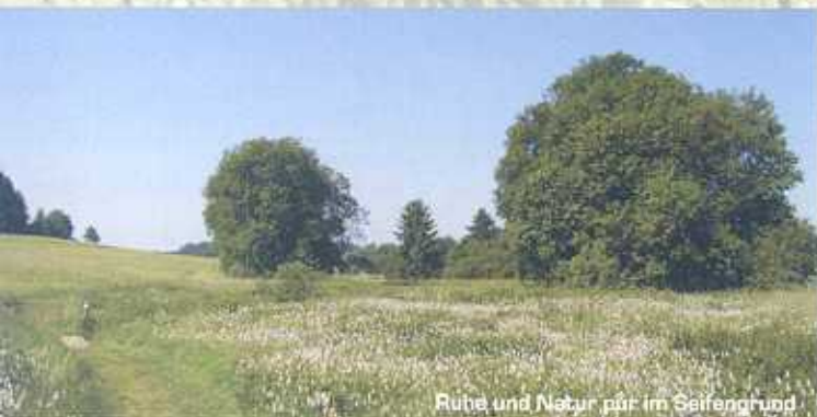
Ruhe und Natur pur im Seifengrund