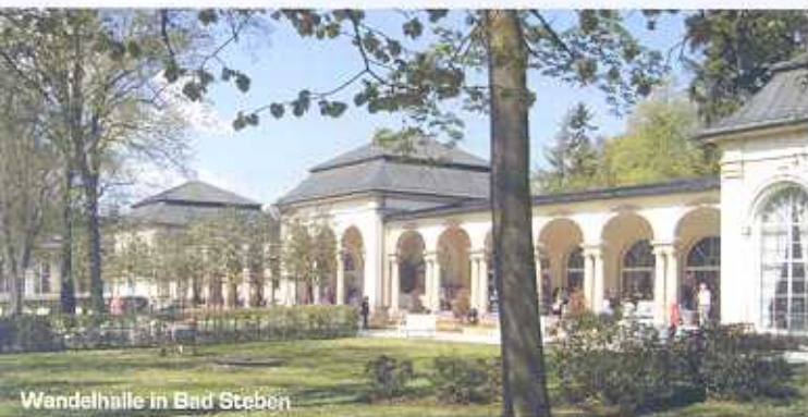
Wandelhalle in Bad Steben